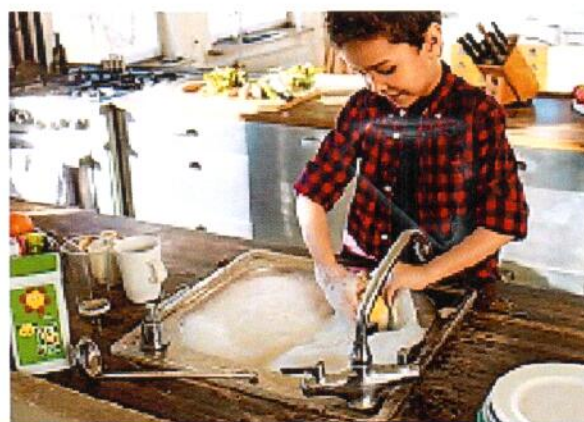
En cuisine, les enfants peuvent, par exemple, aider à éplucher les légumes ou faire la vaisselle.

peuvent accomplir s'ils vivent en ville. Il vaut mieux leur donner un délai au lieu d'exiger qu'ils s'en chargent immédiatement. Ou choisir des tâches qu'ils apprécient, comme par exemple promener un animal de compagnie.