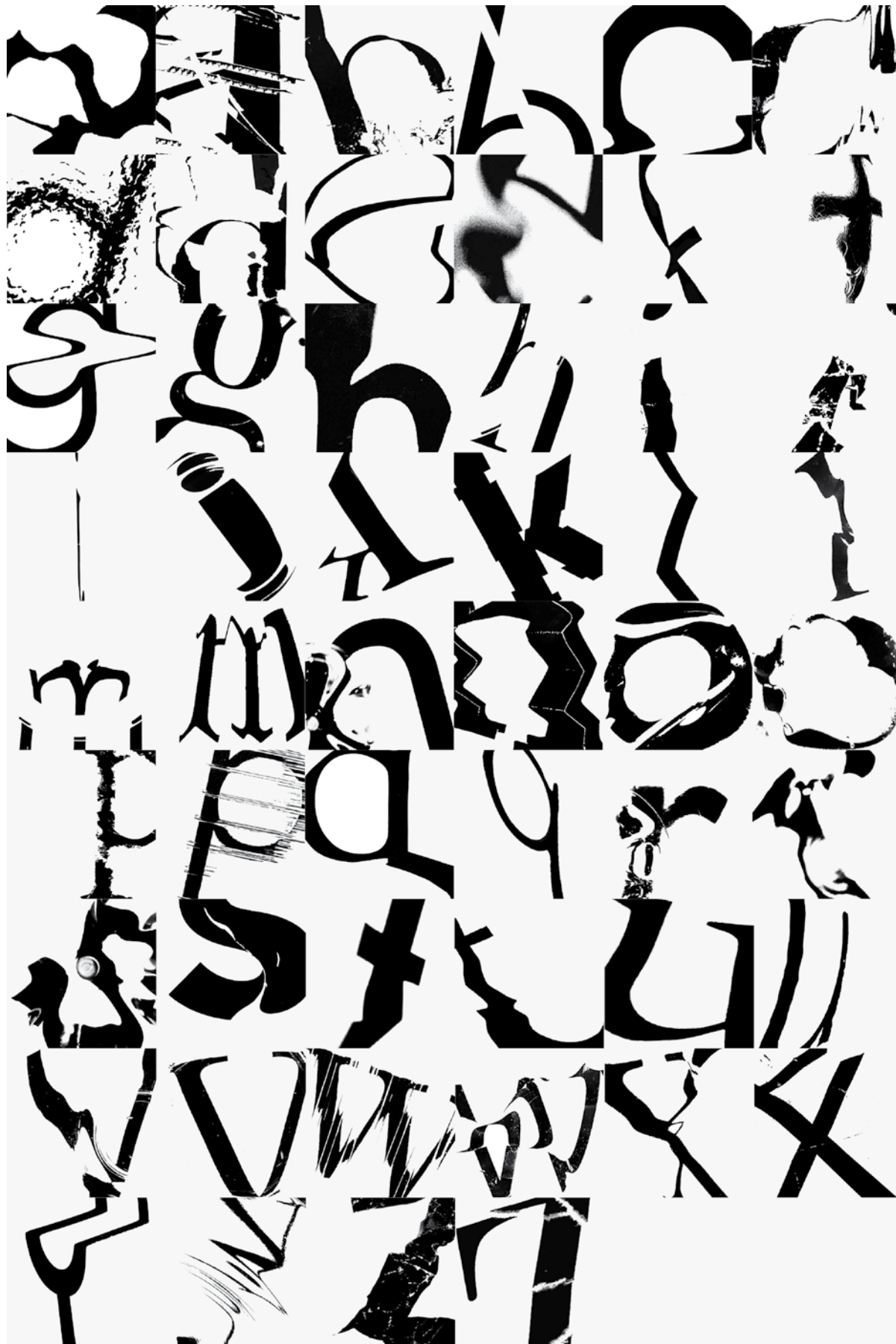
Lavoro di gruppo, 1° anno di grafica – CSIA