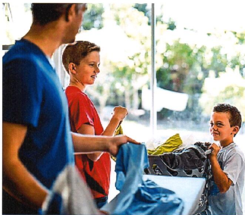
La suddivisione dei lavori domestici inizia sin dalla prima infanzia. In questo modo, i bambini diventano responsabili e svolgono il proprio ruolo con autorevolezza.

... Possono aiutare a riordinare le posate nei cassetti. Se i genitori gli preparano i vestiti, vestirsi e svestirsi da soli. Infine, possono cambiare il rotolo della carta igienica quando è finito.